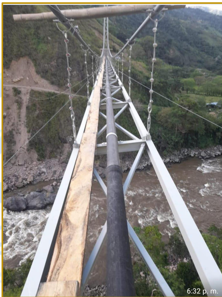
VIADUCTO ACUEDUCTO ELÍAS